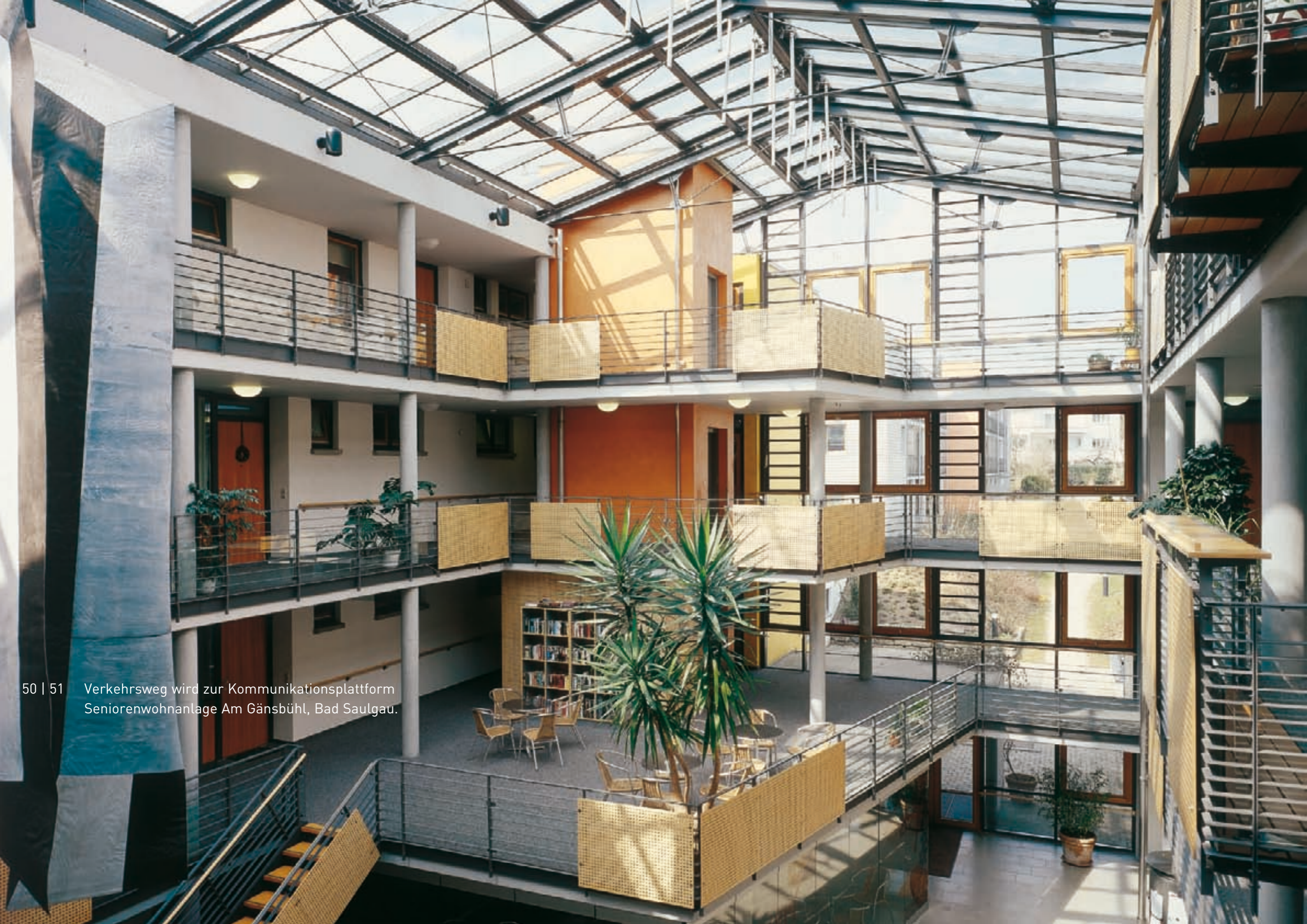
50 | 51 Verkehrsweg wird zur Kommunikationsplattform Seniorenwohnanlage Am Gänsbühl, Bad Saulgau.