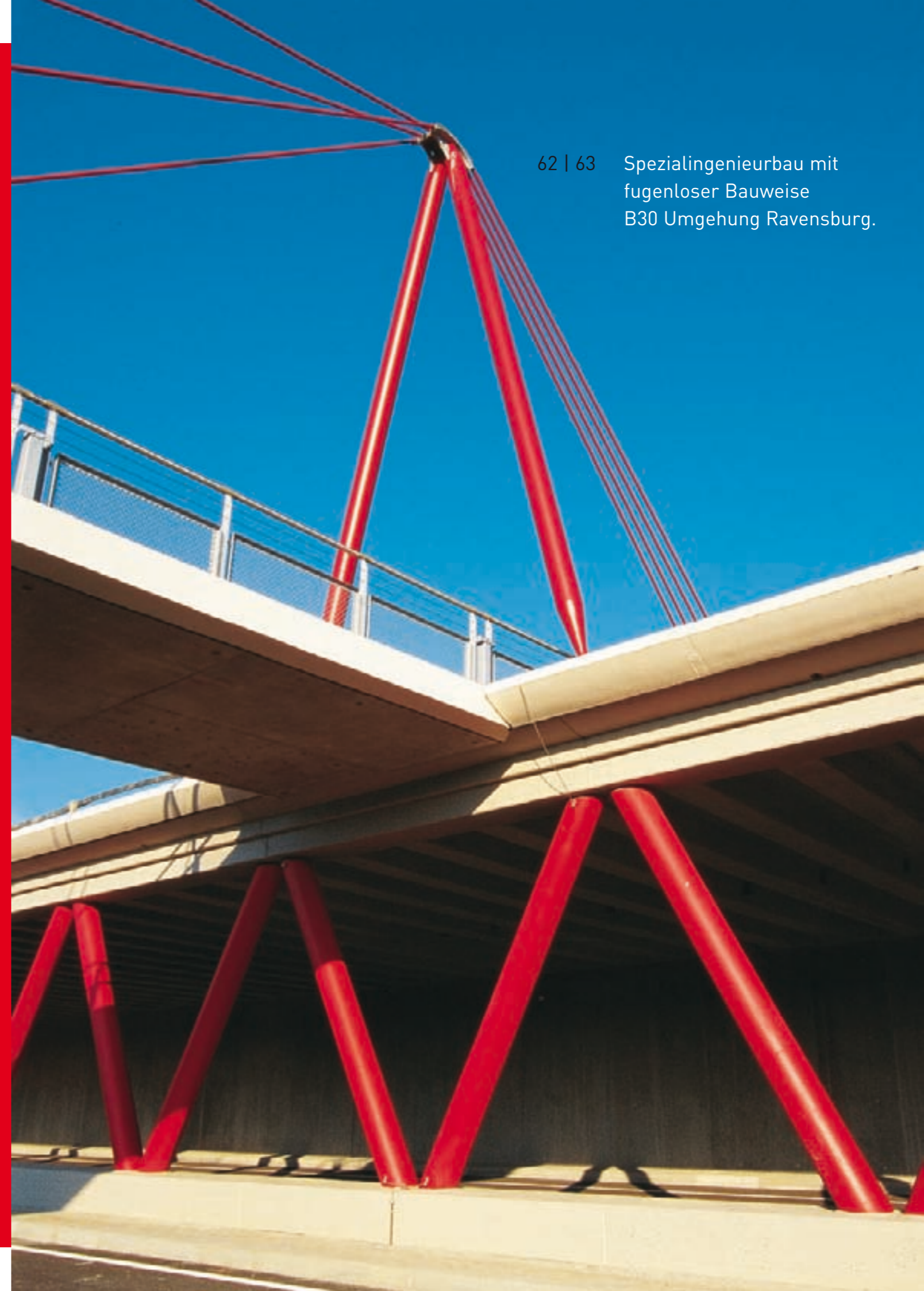
62 | 63 Spezialingenieurbau mit fugenloser Bauweise B30 Umgehung Ravensburg.