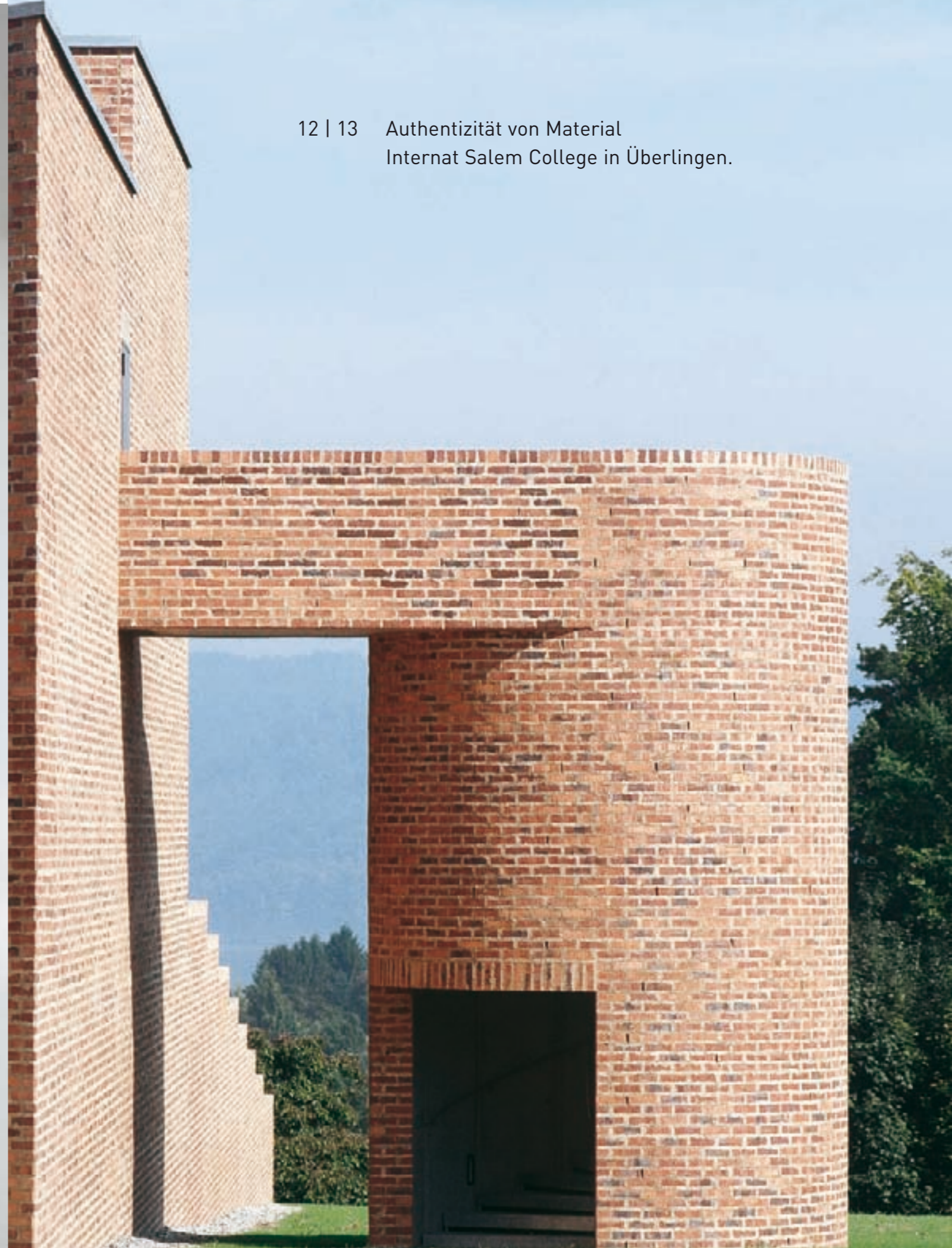
12 | 13 Authentizität von Material Internat Salem College in Überlingen.