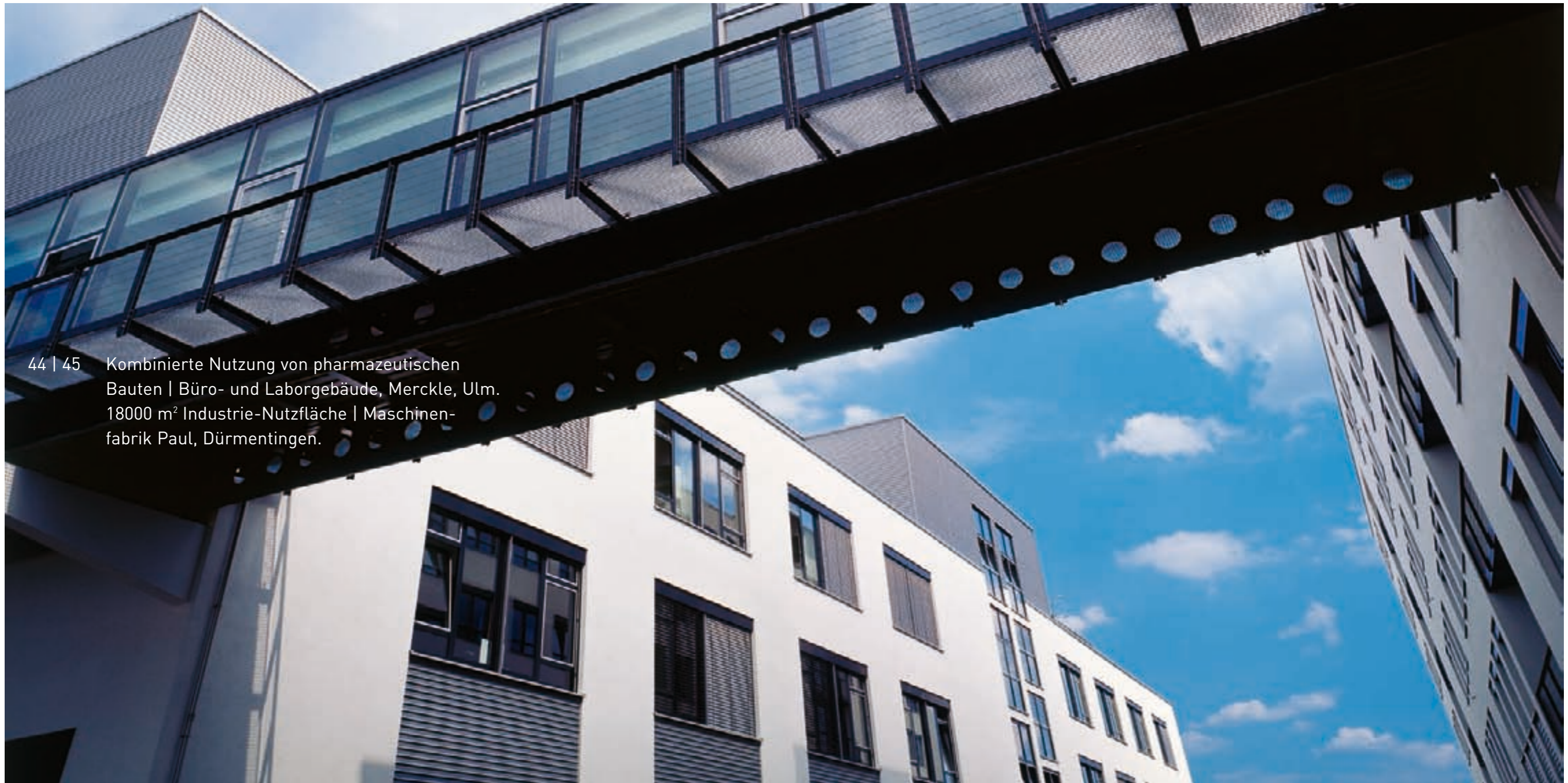
44 | 45 Kombinierte Nutzung von pharmazeutischen Bauten | Büro- und Laborgebäude, Merckle, Ulm. 18000 m 2 Industrie-Nutzfläche | Maschinenfabrik Paul, Dürmentingen.