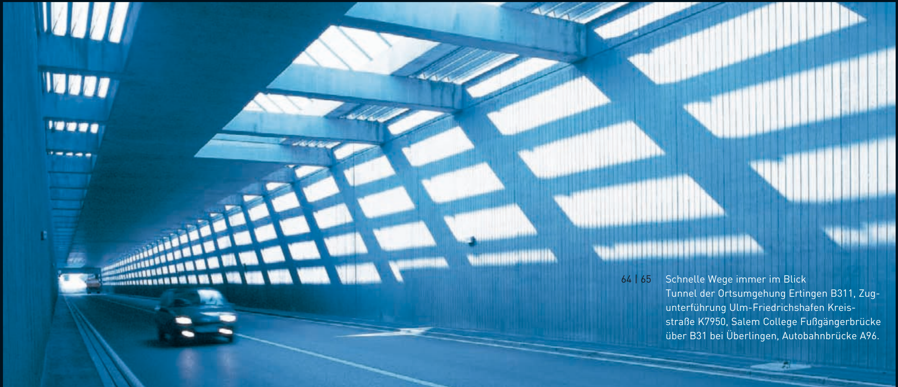
64 | 65 Schnelle Wege immer im Blick Tunnel der Ortsumgehung Ertingen B311, Zug- unterführung Ulm-Friedrichshafen Kreis- straße K7950, Salem College Fußgängerbrücke über B31 bei Überlingen, Autobahnbrücke A96.