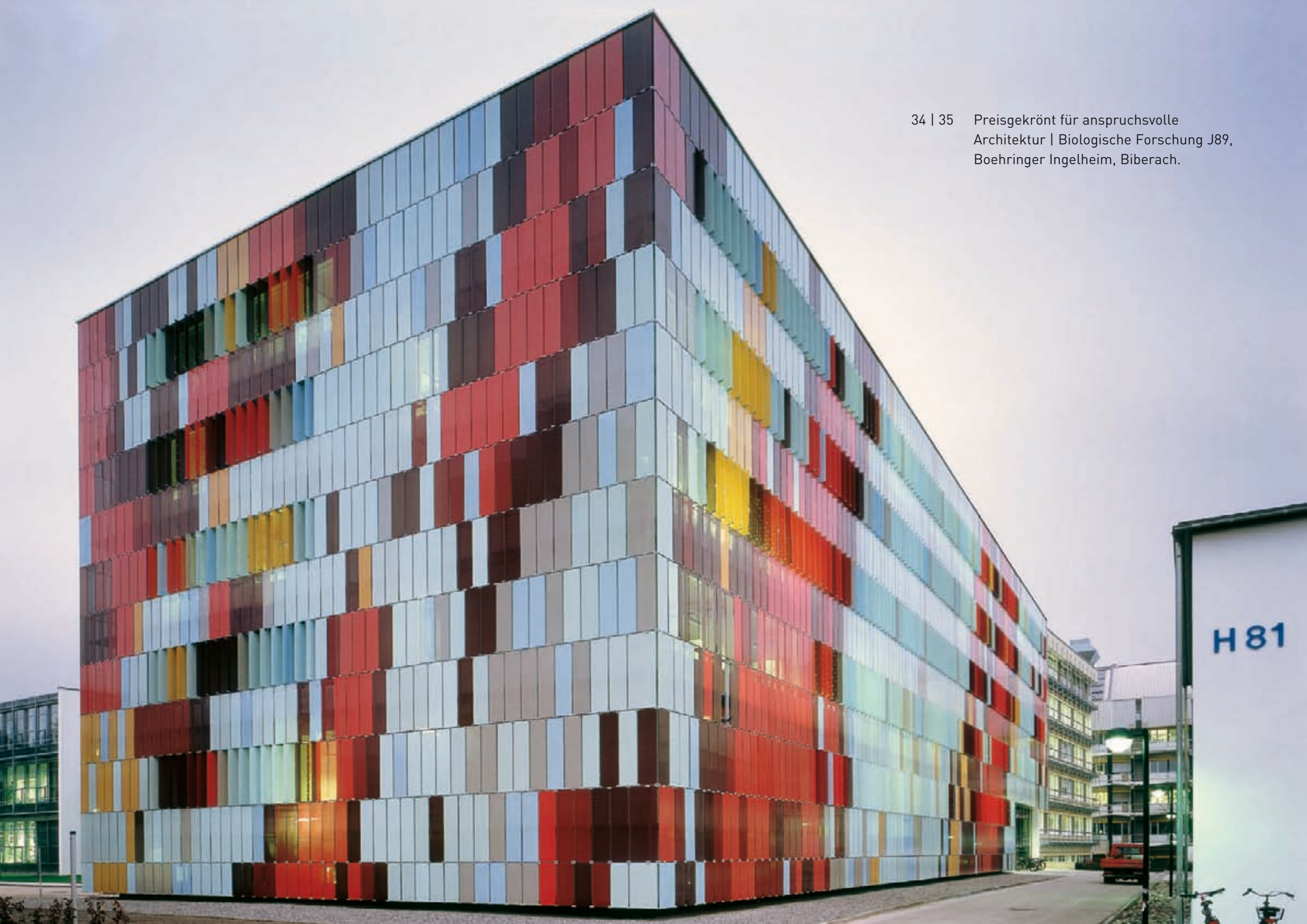
34 | 35 Preisgekrönt für anspruchsvolle Architektur | Biologische Forschung J89, Boehringer Ingelheim, Biberach.