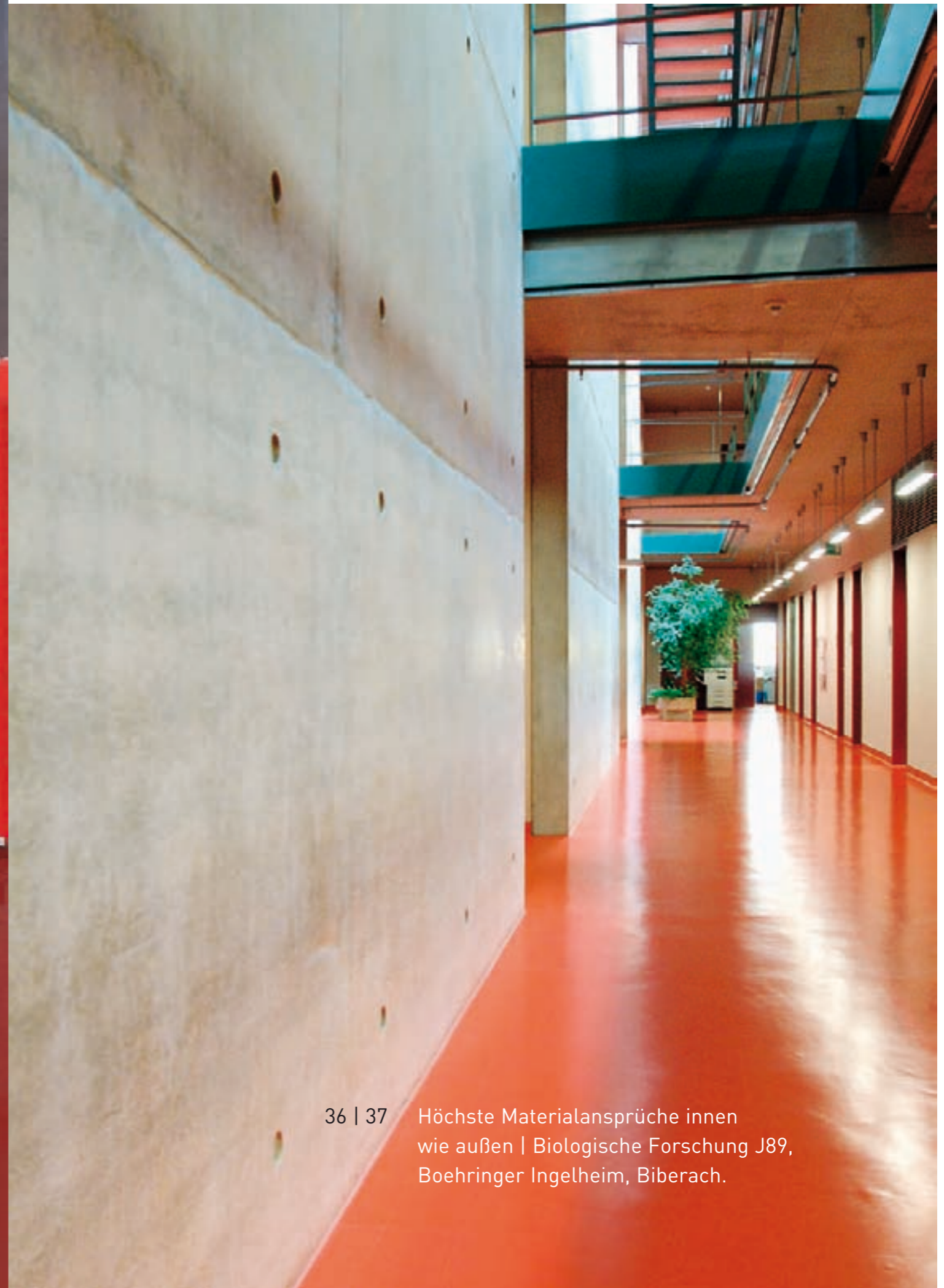
36 | 37 Höchste Materialansprüche innen wie außen | Biologische Forschung J89, Boehringer Ingelheim, Biberach.