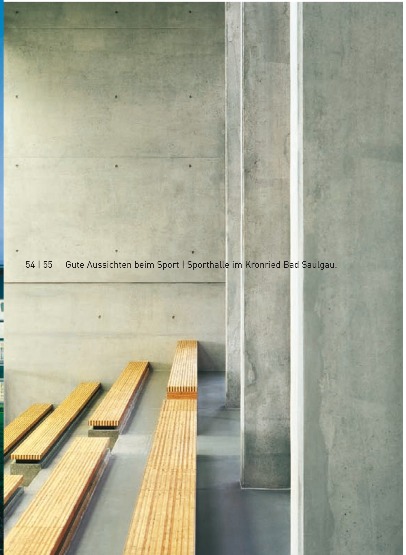
54 | 55 Gute Aussichten beim Sport | Sporthalle im Kronried Bad Saulgau.